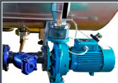
Pompa di circolazione