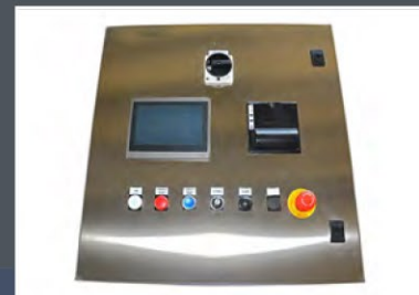
Pannello di controllo