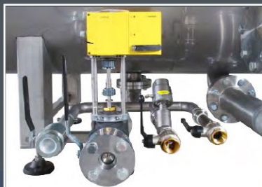
Gruppo valvole ingresso